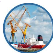
Activités et Services Portuaires